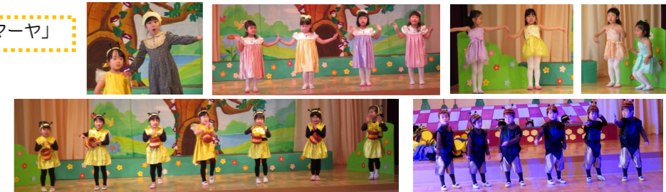
すみれ組5歳児 オペレッタ「アリババと40人の盗賊」