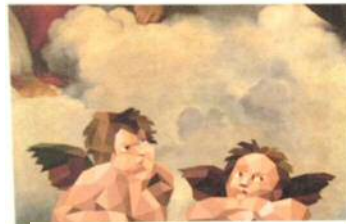
システイーナの聖母