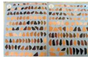
台紙に貼るシール