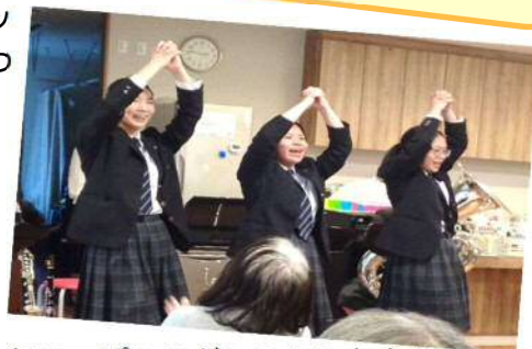
元気いっぱいのダンスにみなさん大きな拍手を送りました