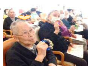
ご利用者様とのふれあい