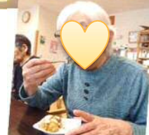
「いただきま〜す」みなさんお代わりにします。ウイナーが人気