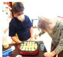
調理師免許を持つ98歳のMさんは鮮やかな手つきで返していきます