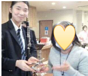
「ありがとう」と、ご利用者様からお礼のプレゼントです

♪いとまきまき～、♪大きな栗の木の下で～、職員も一緒に「手遊び歌」のメドレーで、体を動かします