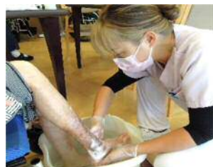
看護師による医療ケア