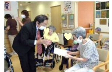
敬老の日、長寿を祝って表彰します