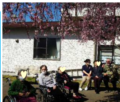
みんなと一緒のお花見に気分もウキウキ!