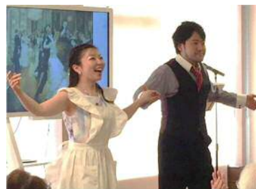
本格的なオペラです

月に2～3回行われるコンサートなどのイベントにも参加して、出演者や地域の方々と交流したり、お花見や小学校の運動会に招かれるなど、社会参加も盛んに行われています。