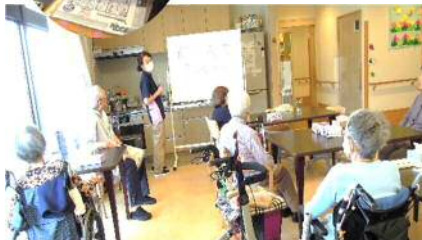
みんなで脳トレ、真剣です