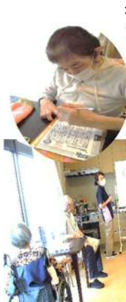
折り紙でフロアを飾ります