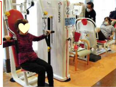
人気のパワーリハビリ

専属トレーナーが考案したK I (ケイアイ) 体操やパワーリハビリテーション、脳トレ、折り紙やちぎり絵、習字などの創作活動に取り組んでいます。