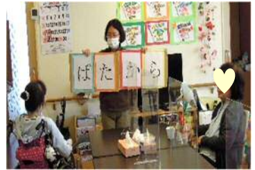
食事の前にしっかり噛み、上手に飲み込むために口腔体操を行っています。

↑ 昼食、夕食の配食サービスも利用できます。食が進まない方には、食べられるものを購入したり、ご家族が差し入れしたりしています。