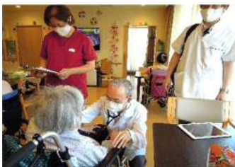
医師による訪問診療