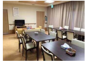
食事やレクリエーションなどをするフロア

「看護小規模多機能 敬愛の森」に登録すると、下図のような通い（デイサービス）、泊まり（ショートステイ）、訪問介護（ヘルパー）、訪問看護、ケアマネジメントの5つのサービスを組み合わせて利用できます。