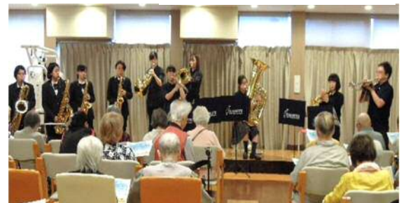
女子高生の吹奏楽

看護小規模多機能型居宅介護を利用できる方 東村山市に住み票がある要介護1～5の方