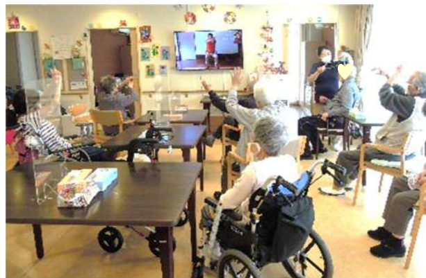
毎日K I体操で身体を動かしています