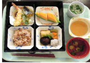
お誕生日会や敬老の日、ひな祭りなど、毎月1～2回、行事食を提供しています。

栄養士・調理師の支援により、塩分管理・糖分管理・カロリー管理、食事形態など、お一人ひとりに配慮した食事を提供しています。