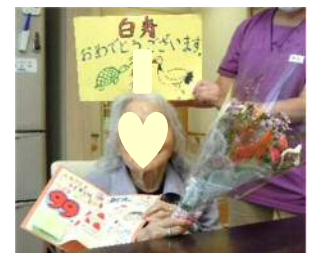
毎月のお誕生日会で花束とカードをプレゼント