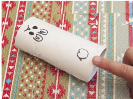
① <トイレットペーパー-パ-ジャンプ> ・トイレットペーパーに描くだけ！

なかなか外に遊びに出られない時に、自宅で身近にある素材や材料で簡単に楽しめる室内遊びです。お子さんとぜひ遊んでみて下さい。また、帰宅後の手洗いを楽しくきれいに出来るといいですね！