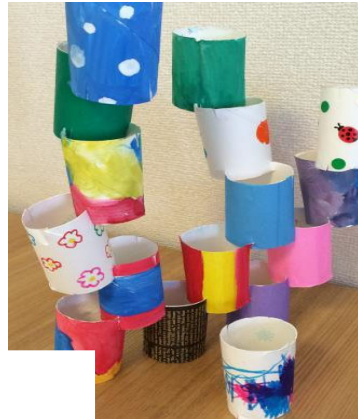
②<トイレットペーパー-タワー> ・トイレットペーパーに描く ・切り込みを入れ高く組立てて遊ぶ