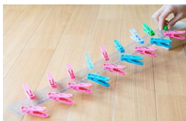
④<洗濯バサミ滑り台> ・定規に洗濯バサミをつける ・高さをつけ、上からビー玉を転がす