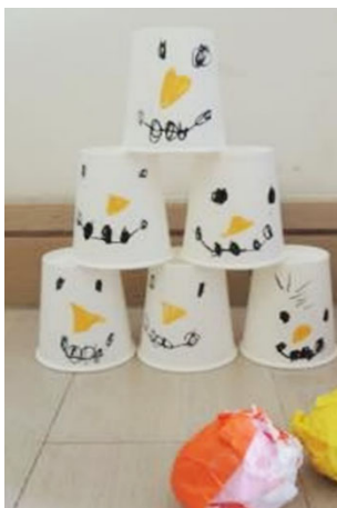
③<紙コップ-タワー> ・紙コップに描く ・紙コップを重ね立て、紙を丸めて倒して遊ぶ