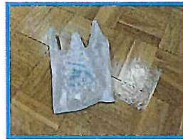
汚物入れ(おむつ・使用)