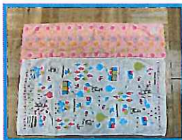
バスタオル・・・2枚