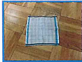
おしぼり・・・3枚