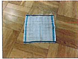
おしぼり・・・3枚