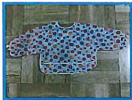
エプロン・・・3枚