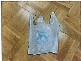
汚物入れ・・・2枚