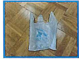
汚物入れ・・・2枚 (おしぼり用・洋服用)