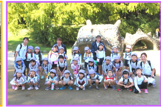
「若葉緑地公園」 もも組3歳児